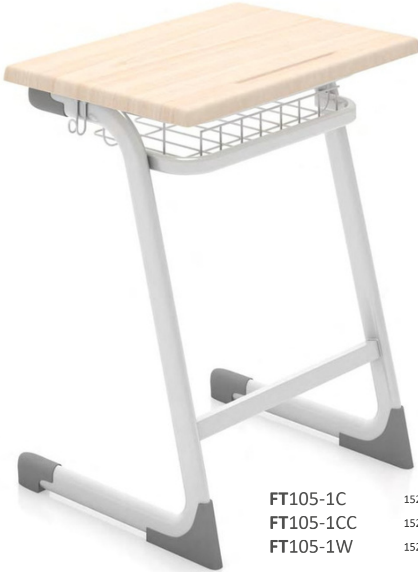
FT105-1C 152200323 FT105-1CC 152200324 FT105-1W 152200196