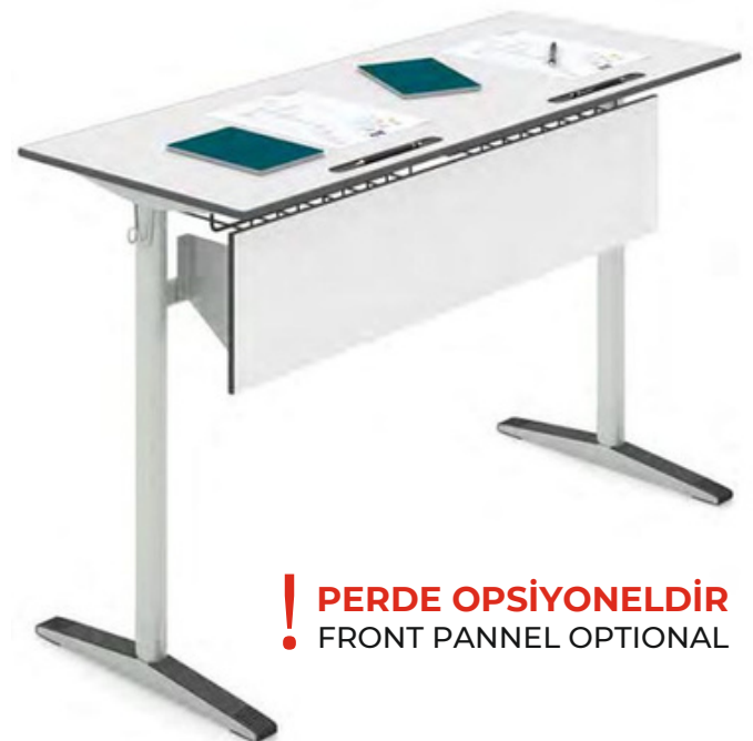
Table top is 12 mm and its dimensions are 50x120 cm. it is made of compact laminate or kopalit op onally. it is rounded. 2mm carrier horizontal sides are made of DKP, shaped by laser cu ng and bent by giving a special form. Dimension of legs are 32x50x2mm and made of oval profile. Dimension of center stretcher is 20x40x1,5 mm made of oval profile. Its bookshelf is produced as Q5 mm transmission mile. All metal components are painted with electrosta c paint and PE plas c boots are used for its ground parts.

! PERDE OPSİYONELDİR • FRONT PANNEL OPTIONAL