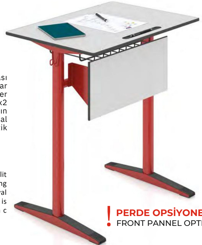
Table top is 12 mm and its dimensions are 50x70cm. it is made of compact laminate or kopalit op onally. it is rounded. 2mm carrier horizontal sides are made of DKP, shaped by laser cu ng and bent by giving a special form. Dimension of legs are 32x50x2 mm and made of oval profile. Dimension of center stretcher is 20x40x1,5mm made of oval profile. Its bookshelf is produced as Q5 mm transmission mile. All metal components are painted with electrosta c paint and PE plas c boots are used for its ground parts.

! PERDE OPSİYONELDİR • FRONT PANNEL OPTIONAL